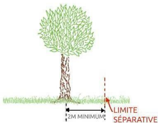
ARBRE DE PLUS DE 2M