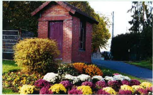
Dans le cadre de l'embellissement du Bourg, le parterre d'entrée à la Bascule.