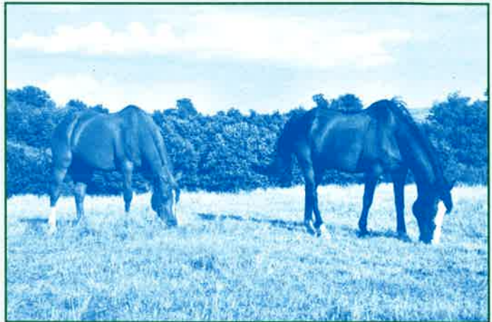
Un repos mérité après une sortie réussie !

Tous les participants ont terminé cette soirée par un bal très animé, une chaude ambiance et une grande convivialité.