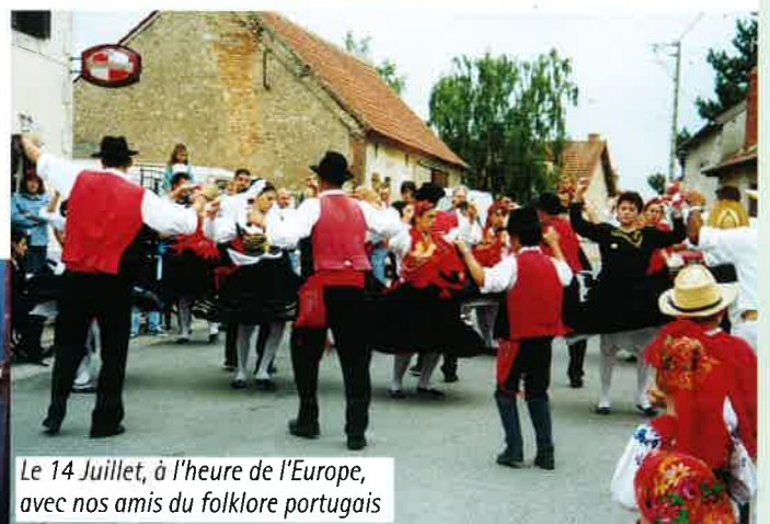
Le 14 Juillet, à l'heure de l'Europe, avec nos amis du folklore portugais