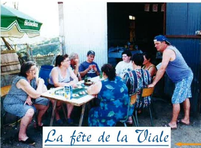
La fête de la Viale

Pour la 5ème édition, la "Confrérie des mangeurs de Tête de Veau" s'est réunie à la Viale autour du traditionnel repas. Le beau temps, la joie et la convivialité étaient au rendez-vous pour accueillir amis et voisins sur "la place du veau qui tête", où après un bon festin, se sont regroupés joueurs de pétanque, de belote et de parties de cache-cache pour les plus petits.