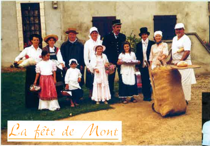
La fête de Mont

Le hameau de Mont ayant choisi pour thème "les métiers d'autrefois", c'est autour d'un sympathique barbecue que se sont déroulées les différentes animations orchestrées par le garde-champêtre en grande tenue :