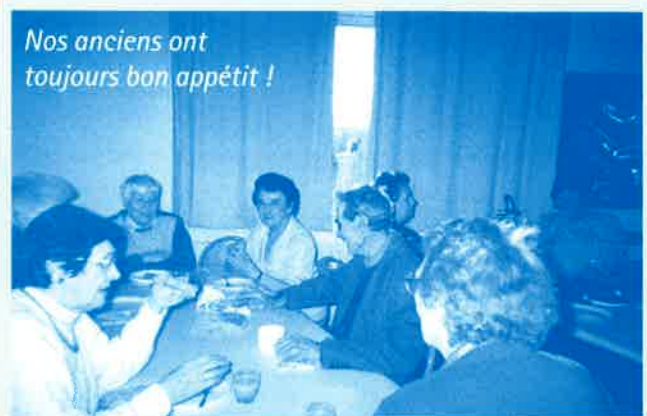
Nos anciens ont toujours bon appétit !