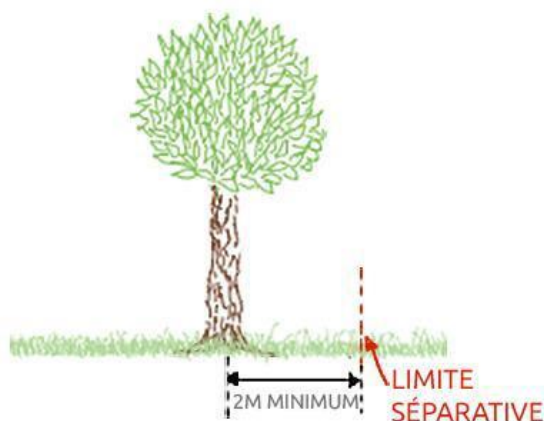
ARBRE DE PLUS DE 2M